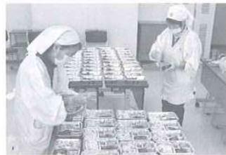
一人暮らし高齢者食事サービス