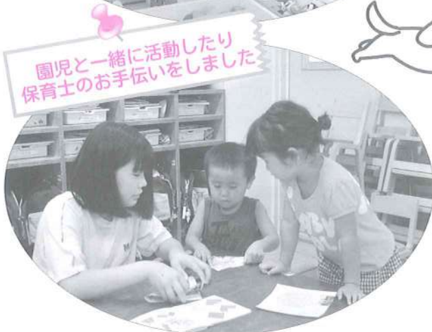
園児と一緒に活動したり 保育士のお手伝いをしました