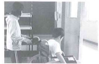
福祉教育への支援