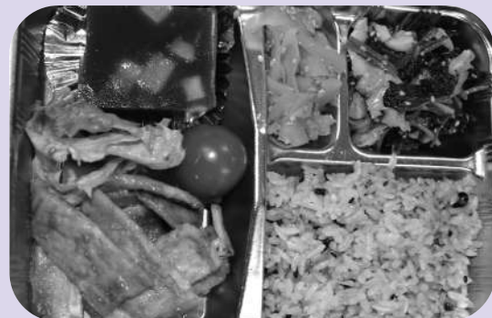
季節や旬のものを取り入れ、栄養バランスのとれたお弁当をお届けしています。

地域の民生委員・児童委員、福祉委員がご自宅までお届けします。案内チラシの配布や希望有無などの取りまとめも行っています。