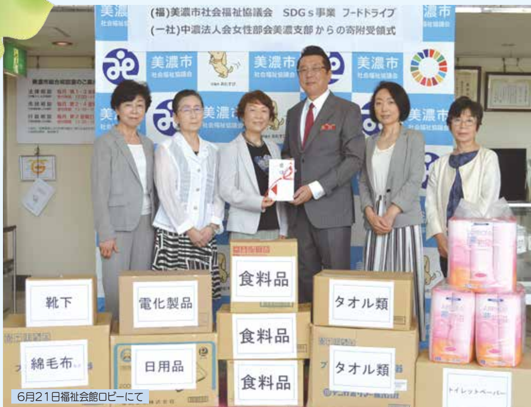
6月21日福祉会館ロビーにて